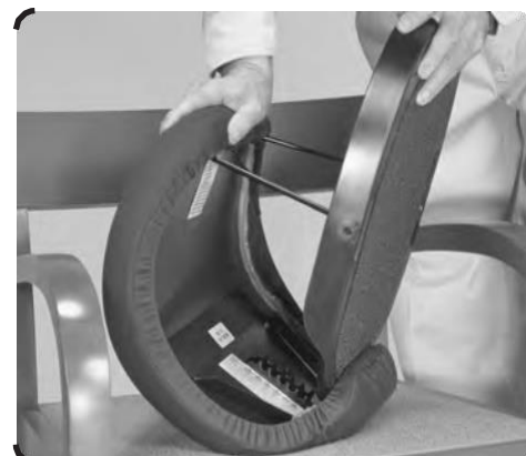
Stlačte výrobek ohnutím polstrované části.