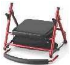
Rám se sedákem, košíkem a zádovou opěrkou