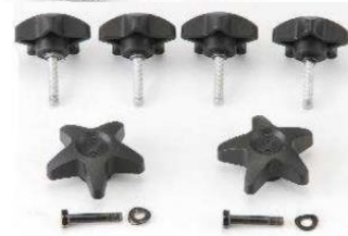
Sada šroubů a matic: (celkem 10 kusů)