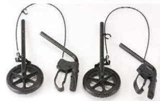
Zadní kolečka s brzdovým systémem