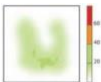
výsledek rozložení tlaku u polštáře KINERIS jednokomorového