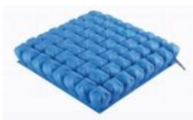
jednokomorový polštář – výška 7 cm nebo 10 cm

Antidekubitní polštáře Kinéris jsou polštáře složené ze vzduchových buněk, které jsou navzájem propojené, což zaručuje plynulé rozložení tlaku a individuální přizpůsobení. Jsou vhodné pro osoby s vysokým potenciálním rizikem vzniku dekubitů (proleženin). Polštáře jednokomorové jsou vhodné pro uživatele bez problémů se stabilitou. Dvoukomorové polštáře zajišťují správnou stabilizaci pánve v sedě a tím pomáhají při prevenci vzniku ložisek dekubitů pro osoby s vysokým rizikem.