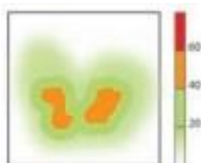
výsledek rozložení tlaku u polštáře vyrobeného z HR pěny – tloušťka 6 cm