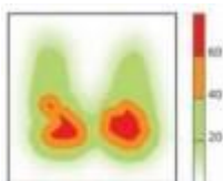
výsledek rozložení tlaku u polštáře vyrobeného z viskoelastického polyuretanového gelu

Příklad rozložení tlaku uživatele s hmotností 75 kg a výškou 172 cm: