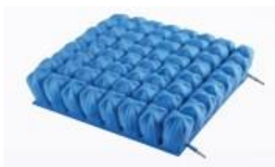
dvoukomorový polštář – výška 7 cm nebo 10 cm

Příklad rozložení tlaku uživatele s hmotností 75 kg a výškou 172 cm: