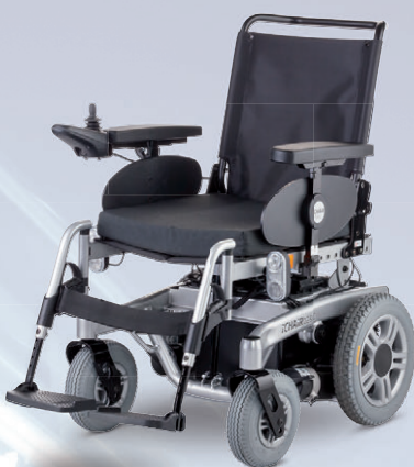
iChair MC Basic 1.609 Kód ZP: 07-0135390 Cena od: 89 900 Kč Doplatek od: 0 Kč