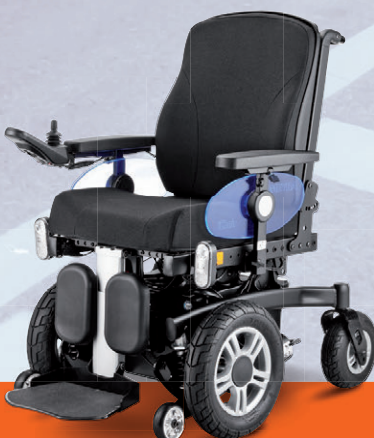
iChair MC FRONT 1.613 Kód ZP: 07-0135447 Cena od: 132 370 Kč Doplatek od: 0 Kč