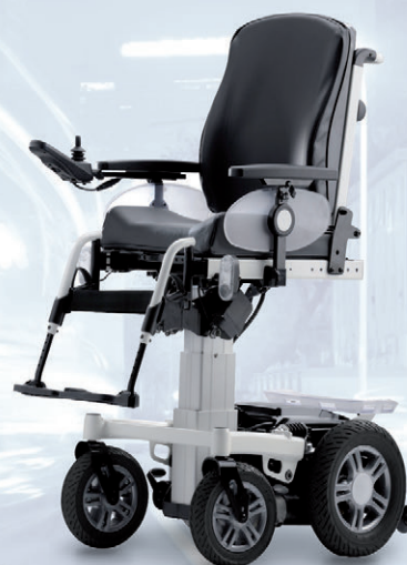
iChair MC3 Lift 1.612-27 Kód ZP: 07-0018936 Cena od: 136 000 Kč Doplatek od: 0 Kč