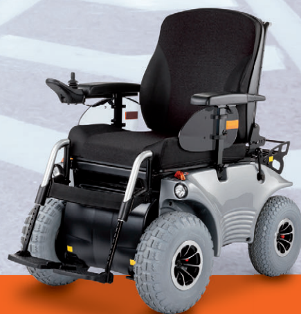
OPTIMUS 2 2.322 Kód ZP: 07-0018937 Cena od: 136 000 Kč Doplatek od: 0 Kč