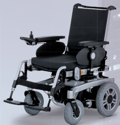
iChair MC1 1.610 Kód ZP: 07-0022471 Cena od: 110 452 Kč Doplatek od: 0 Kč