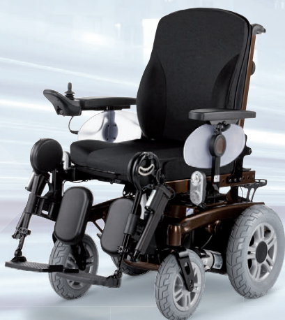
iChair MC2 1.611 Kód ZP: 07-0024183 Cena od: 132 486 Kč Doplatek od: 0 Kč