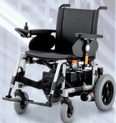
Faster CLOU 9.500 (1.437) Kód ZP: 07-0062245 Cena od: 79 800 Kč Doplatek od: 0 Kč