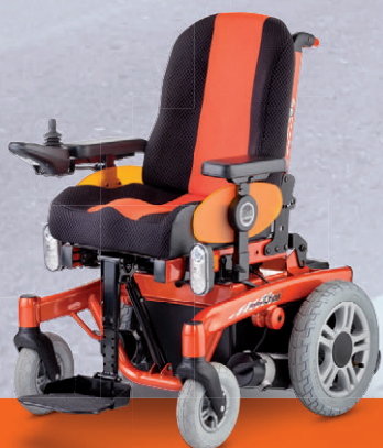
iChair MC2 S 1.616 Kód ZP: 07-0024183 Cena od: 132 486 Kč Doplatek od: 0 Kč