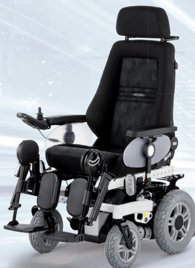
iChair MC3 1.612 Kód ZP: 07-0012051 Cena od: 119 181 Kč Doplatek od: 0 Kč