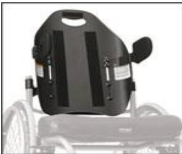
Podpažní opěrky PAL