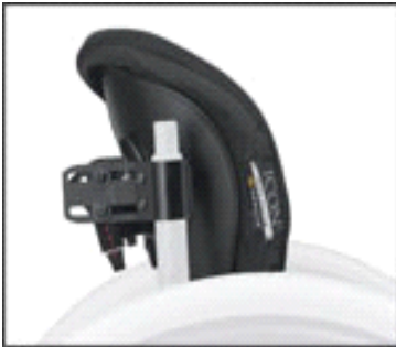
Zádová opěrka ICON